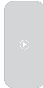
9:16 Totalmente Historia IG