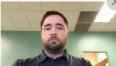
Demasiado abajo Cuando el ángulo de la cámara está demasiado abajo, generalmente no favorece la filmación.