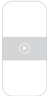
16:9 Paisaje YouTube

Piensa en la ubicación de tu teléfono: si tu contenido aparece en tu historia de Instagram o en tu video Reel, mantenlo en posición vertical. Si es para YouTube o Zoom, mantenlo en posición horizontal. Si lo vas a usar en varias plataformas, filma el video con suficiente espacio para recortar.