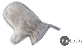
Dusting Mitt (guante limpiapolvo)