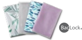
Window Cloth (pañero para ventanas)