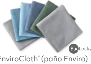
EnviroCloth® (pañero Enviro)